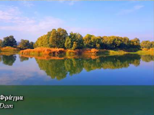
Φράγμα Λυμπίων Dam