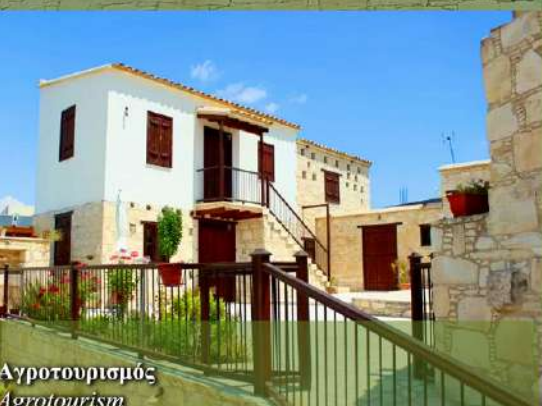
Μνημείο Ηρώων & Κοινοτικό Πάρκο Heroes Monument & Community Park