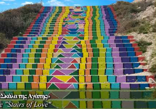
Η σκάλα της αγάπης The "Stairs of Love"