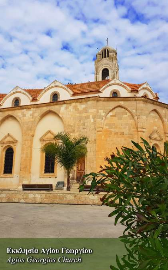
Εκκλησία Αγίου Γεωργίου Agios Georgios Church