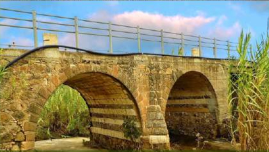
Πέτρινο Γέφυρο Stone Bridge

Αγροτουρισμός Πριν το 2000 πολλά από τα παλιά παραδοσιακά σπήλια του Λυμπίων καταστράφηκαν από τους ιδιοκτήτες τους για να κτίσουν σύγχρονα σπήλια για τα παιδιά. Τέσρα χρόνια αργότερα, οι ιδιοκτήτες έλασαν να παραδοσιακά σπήλια ανακαταστήθηκαν και αρχικά από ούτι ανακαταστάθηκαν και στο πρόγραμμα Αγροτουρισμού με μεγάλη επιτυχία. Ημ, μπορεί να επισκεφτεί κάποιος αρχαίως από παραδοσιακά κτίρια, ζώρες, να κίτα ανακαταστά στην κοινότητα ζώων και κίτα κίτα.