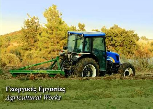
Γεωργικές Εργασίες Agricultural Works