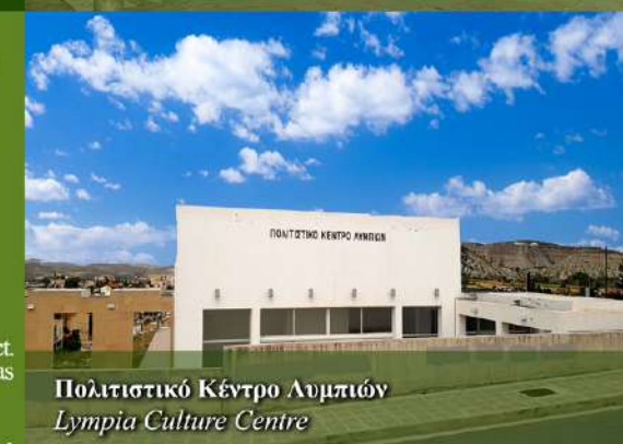
Πολιτιστικό Κέντρο Λυμπίων Lympia Culture Centre

Community Park In addition to a Community Clinic, the Community Park features a Community Library, playground, small pavilion, stage with event square, monument with a bust of the hero Th. Papakonstantis, and a playground. Formerly, the location was a man-made basin where residents gathered for fun in their homes during the winter, the basin filled with water, and the locals christened the resulting lake "Kolymbio." Today, the Community Park, which was established in the early 1990s, serves as a venue for cultural events and even wedding celebrations.