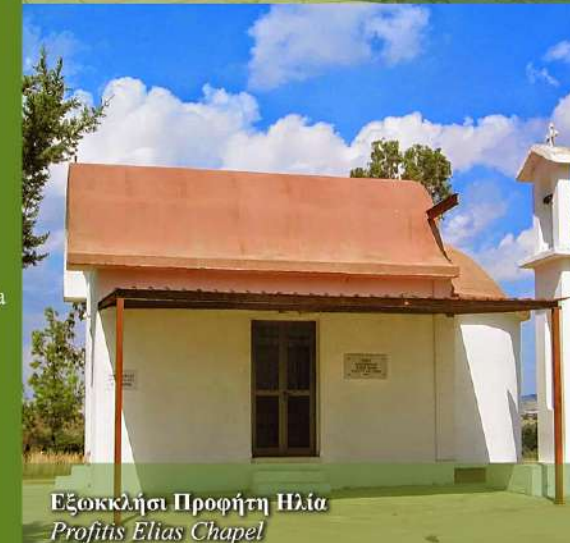
Εκκλησία Προφήτη Ηλία Prophet Elias Chapel