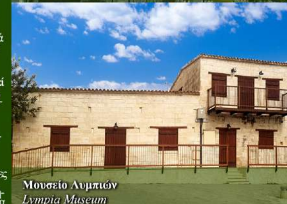
Μουσείο Λυμπίων Lympia Museum