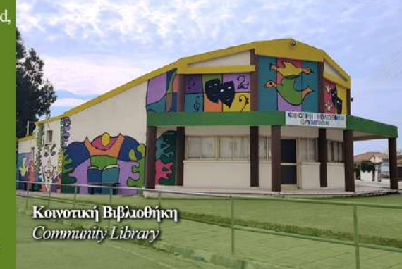
Κοινοτική Βιβλιοθήκη Community Library